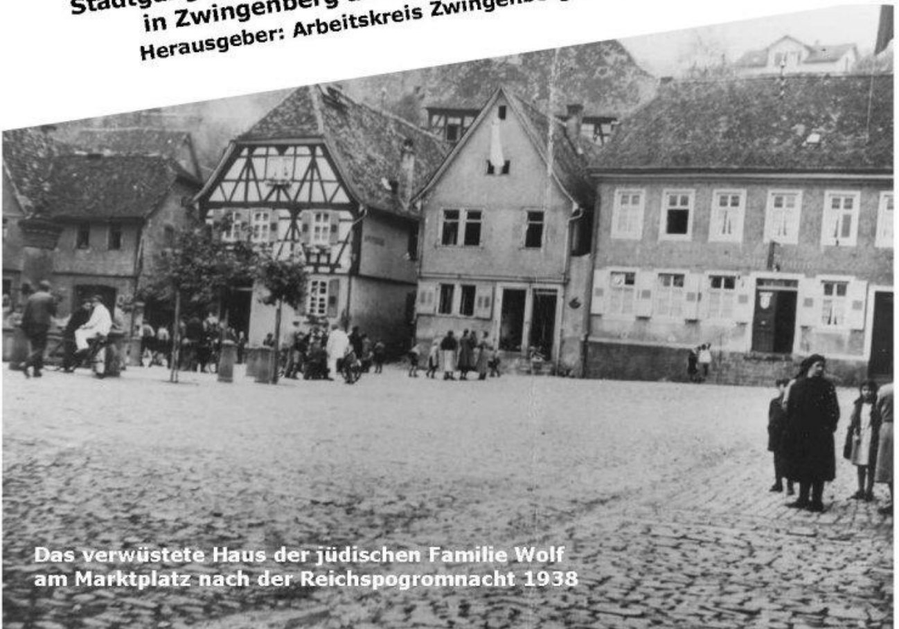
Das verwüstete Haus der jüdischen Familie Wolf am Marktplatz nach der Reichspogromnacht 1938