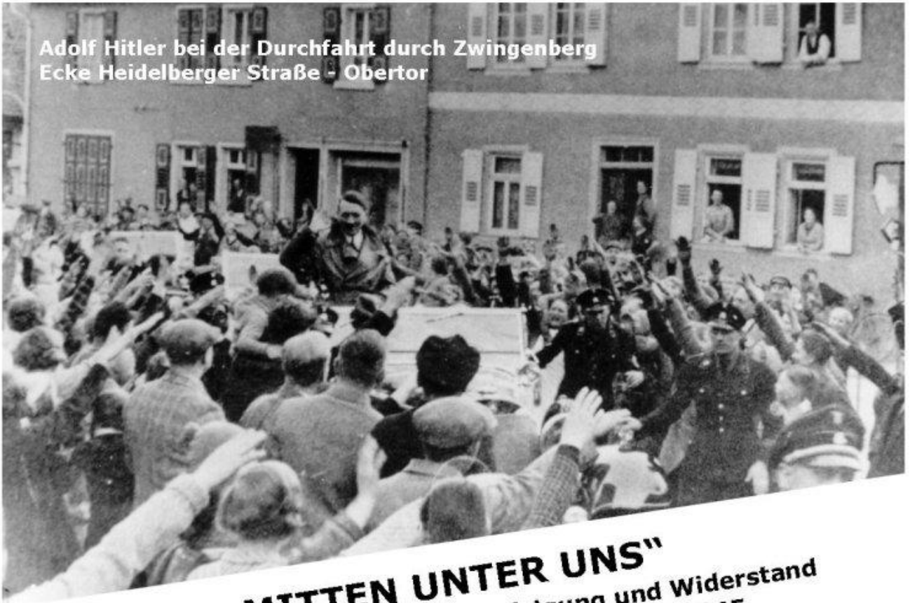
Adolf Hitler bei der Durchfahrt durch Zwingenberg Ecke Heidelberger Straße - Obertor